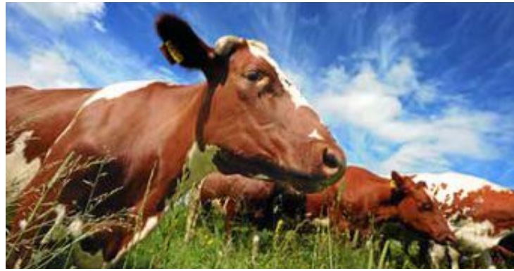
Gullegg: Leserbrevskribenten er blant de mange som drømmer om mulighetene i husdyrgjødsel.

Det er lenge siden Ås bare var landbruket. Den elektriske landbruksroboten «Thorvald» er kanskje et eksempel på at det er bra å kombinere praktisk og jordnær kunnskap med framtidsretta teknologi. Allerede nærmer den autonome og digitale løsningen seg en frukt og grønt sektor hvor den er kommersiell. Fra andre kanten av maskinparken har John Deere begynt å nevne sin pilot på traktor med elektrisk framdrift. Når