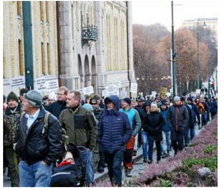
Opptog: Lesarbrevforfatteren meiner det var rart at av NRK å seie at «både bønder, jegerar og vanlege folk» deltok i demonstrasjon mot ulv.