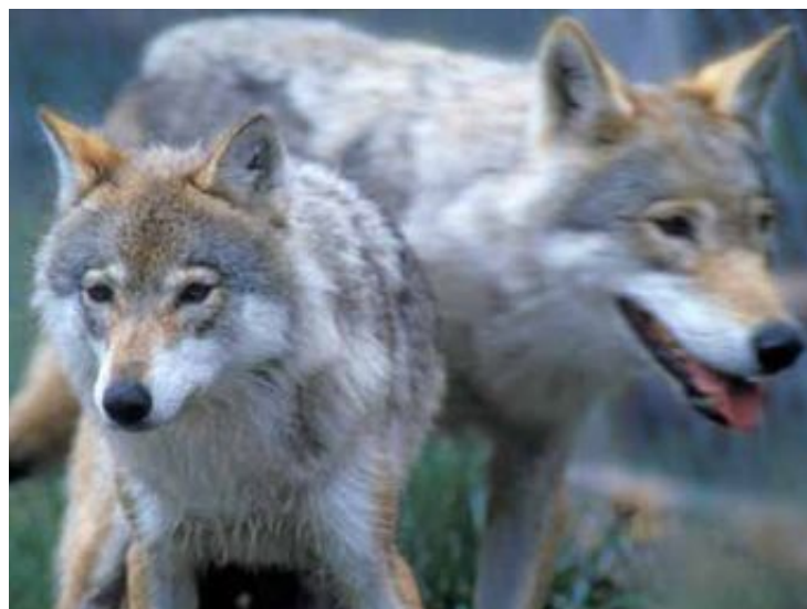
Bindene: Professor Geir Ulfstein ved Universitetet i Oslo mener Bernkonvensjonen er rettslig bindende.

Men heller ikke fraværet av en internasjonal domstol kan